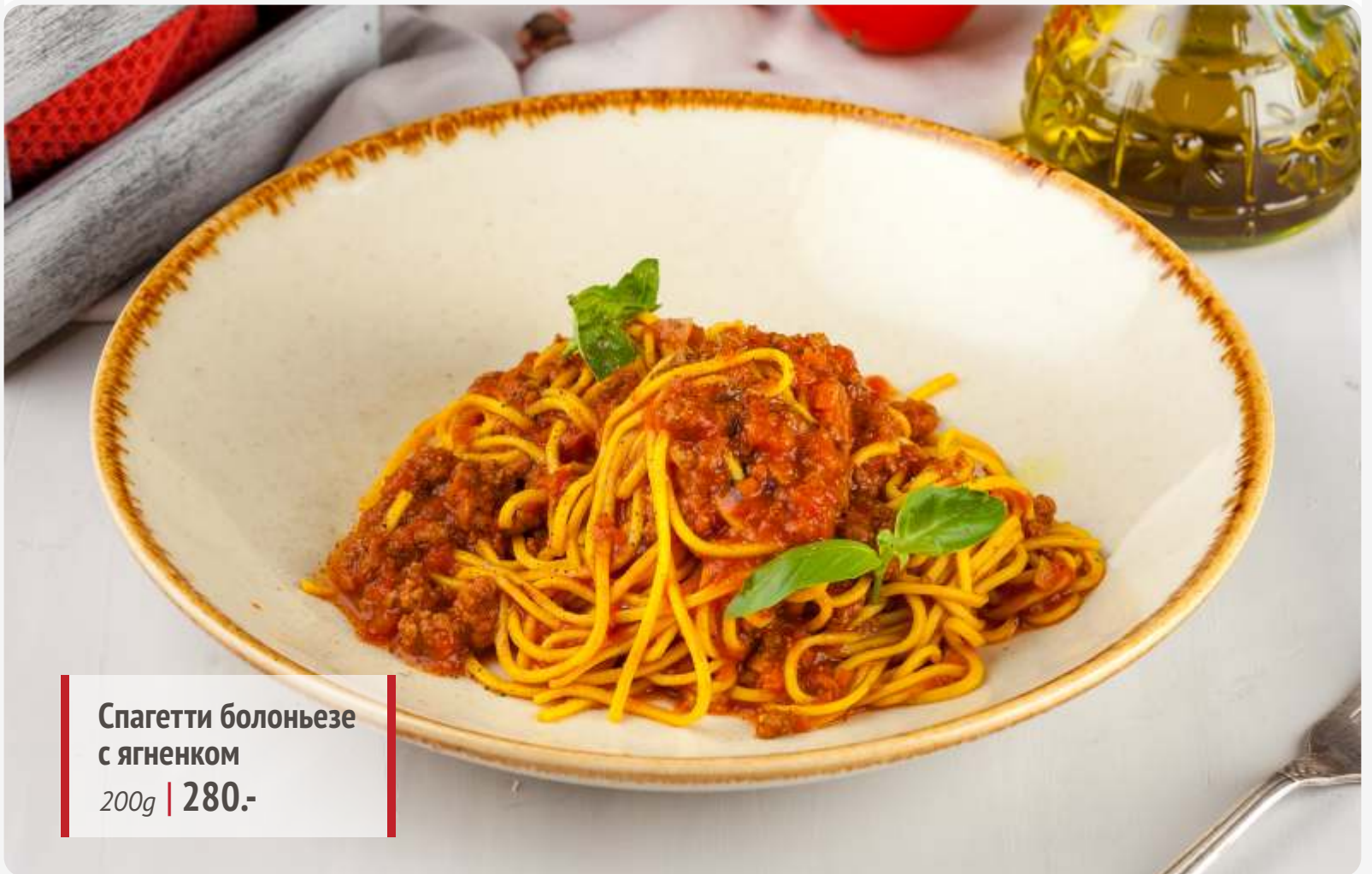
Спагетти болоньезе с ягненком 200g | 280.-