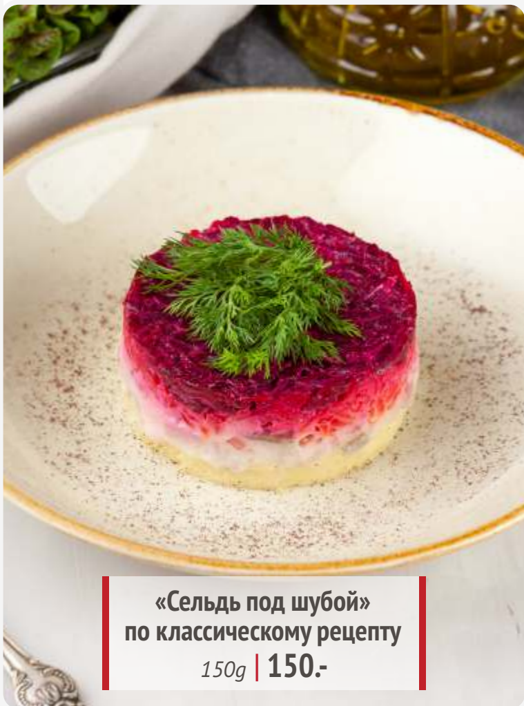
«Сельдь под шубой» по классическому рецепту 150g | 150.-