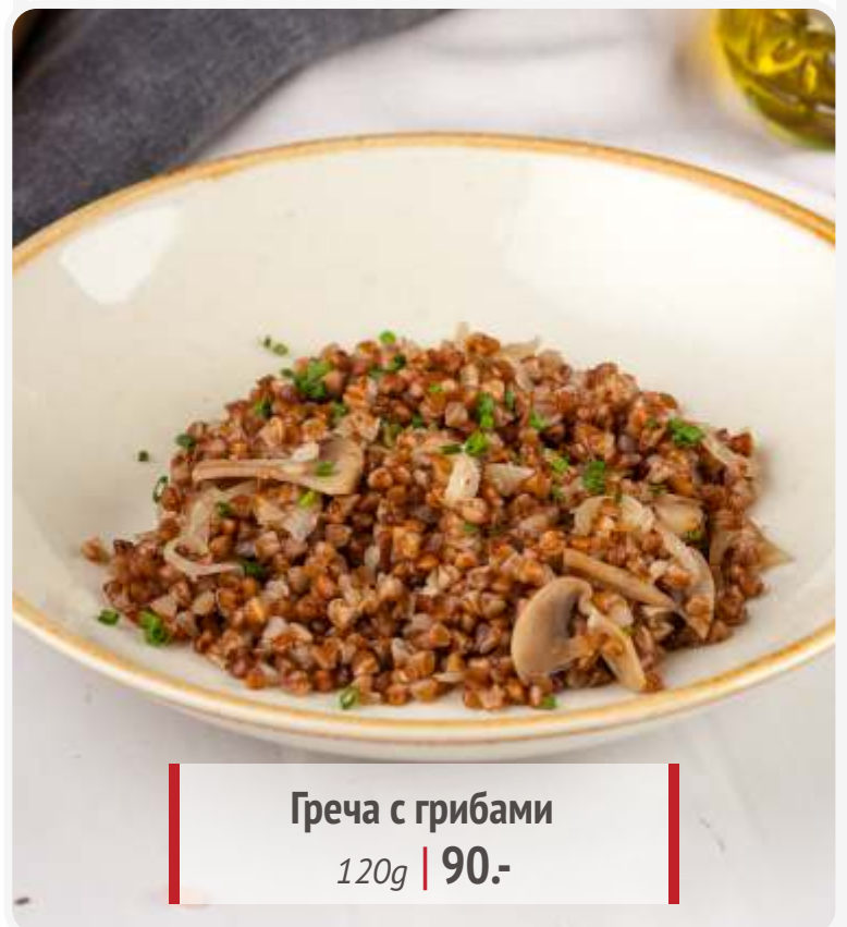
Греча с грибами 120g | 90.-

Если у вас есть аллергия на определенные продукты, просим заранее сообщить об этом официанту.