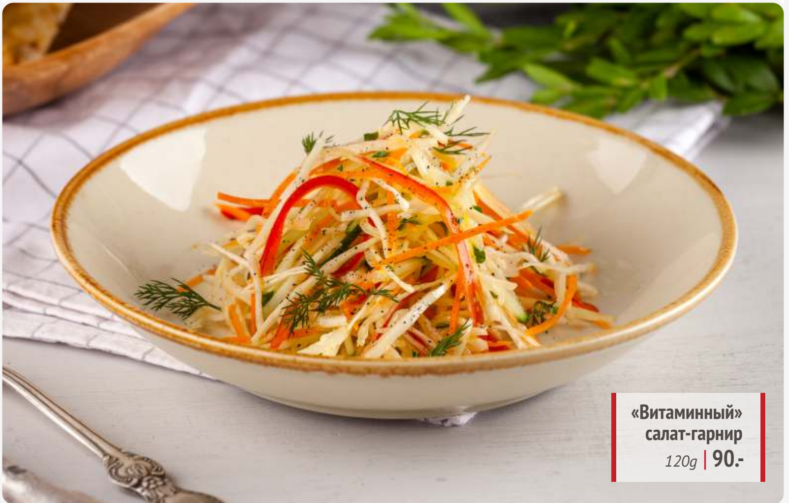
«Витаминный» салат-гарнир 120g | 90.-