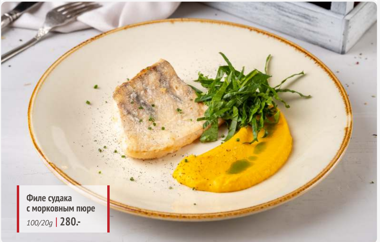
Филе судака с морковным пюре 100/20g | 280.-

Если у вас есть аллергия на определенные продукты, просим заранее сообщить об этом официанту.