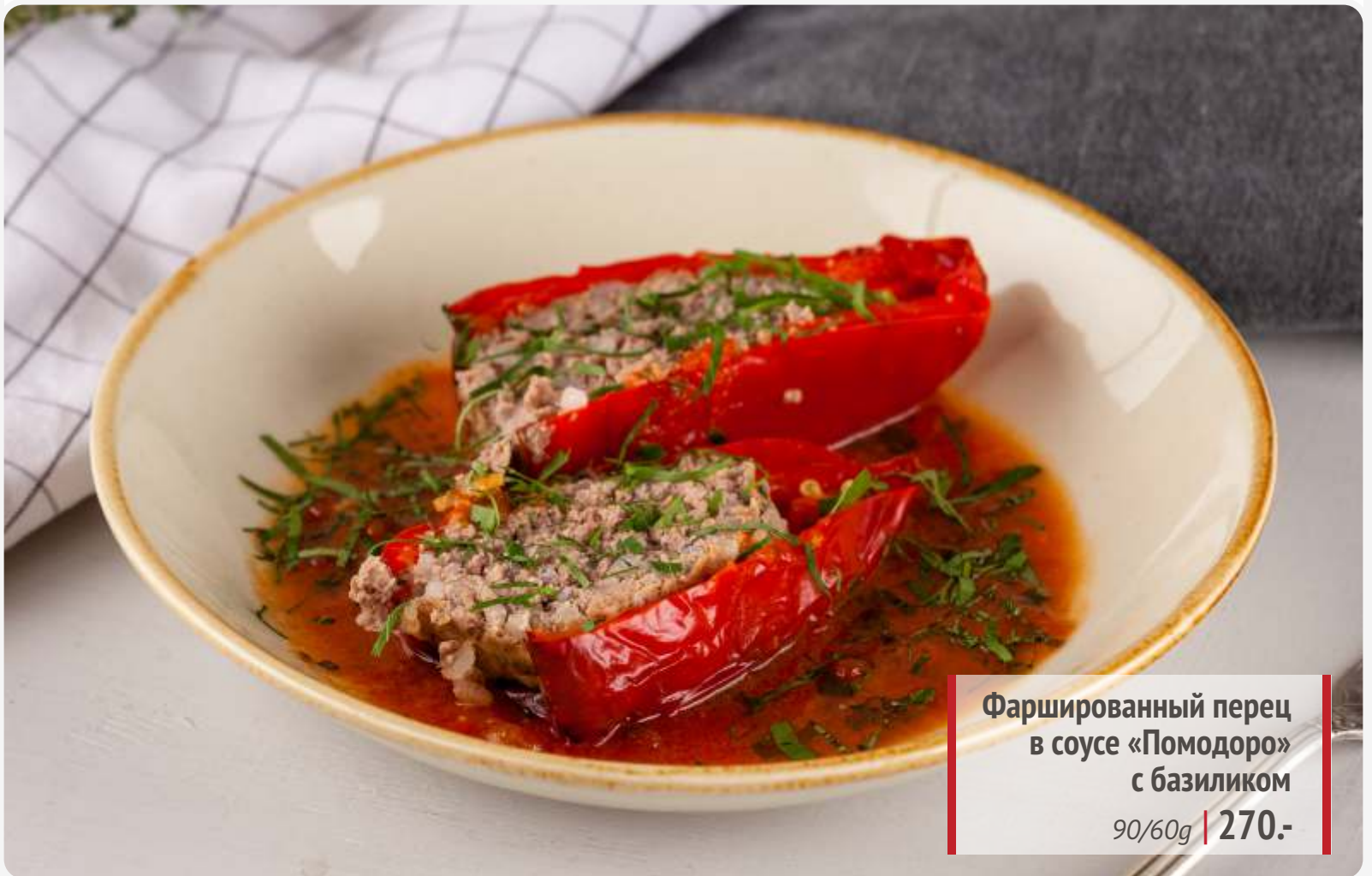
Фаршированный перец в соусе «Помodoro» с базиликом