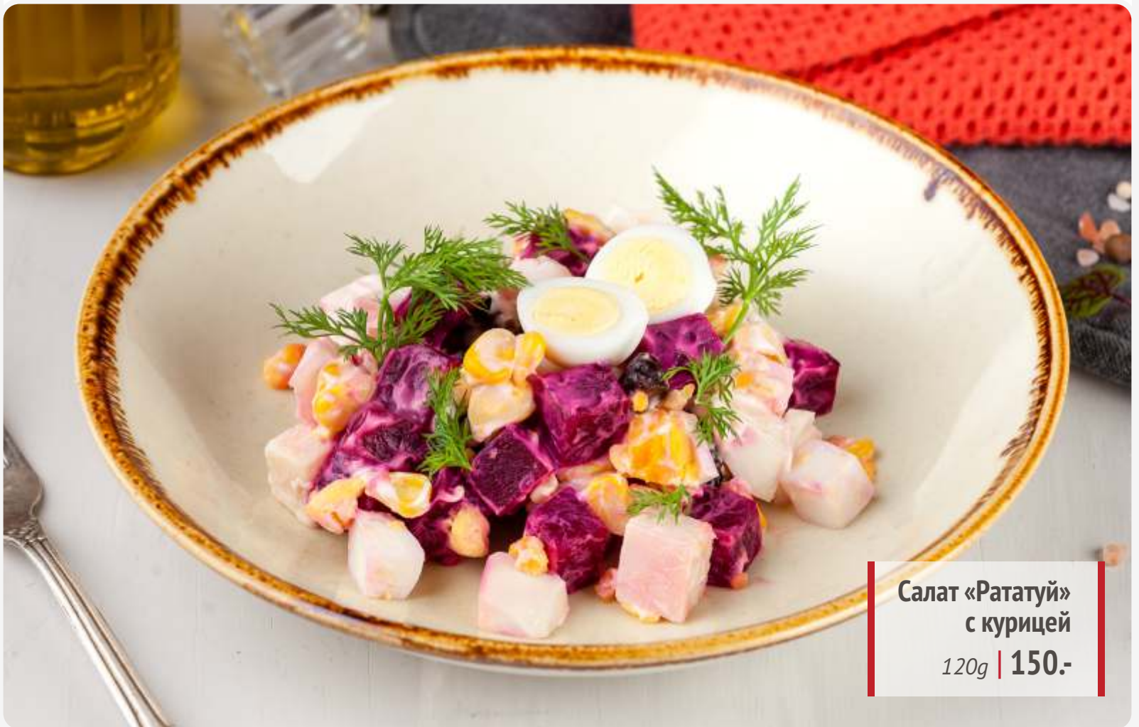
Салат «Рататуй» с курицей 120g | 150.-