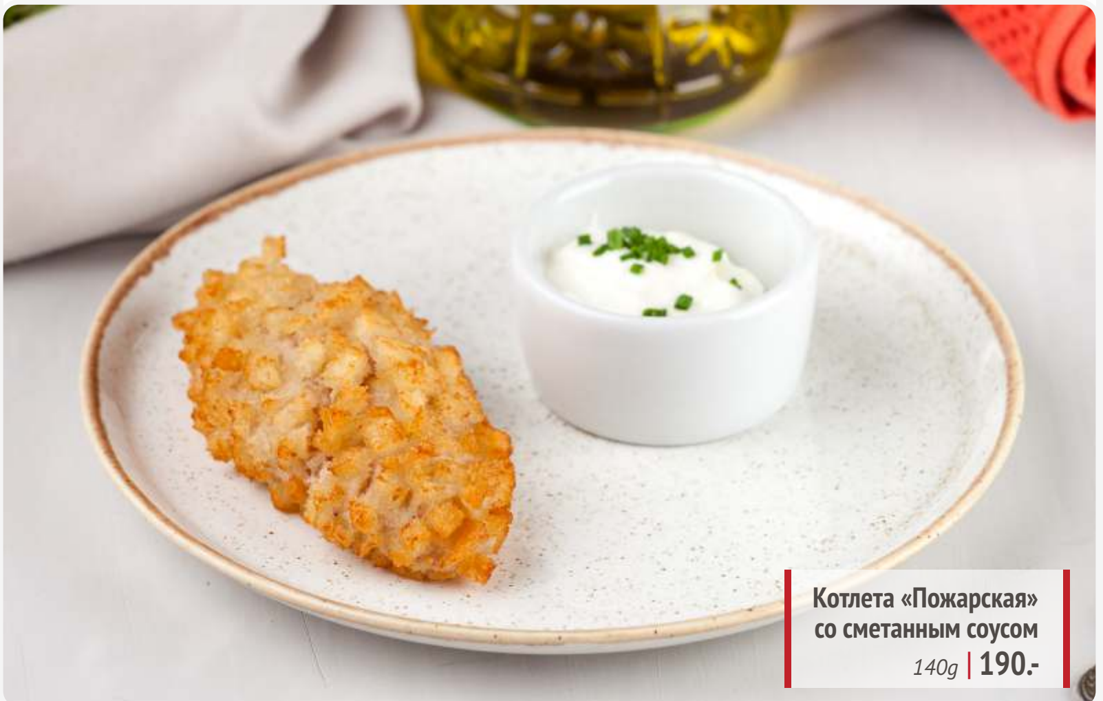
Котлета «Пожарская» со сметанным соусом