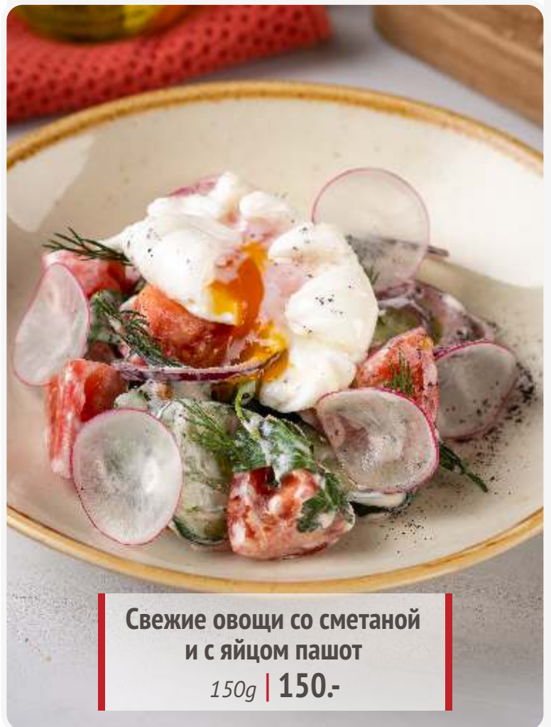
Свежие овощи со сметаной и с яйцом пашот 150g | 150.-

Если у вас есть аллергия на определенные продукты, просим заранее сообщить об этом официанту.