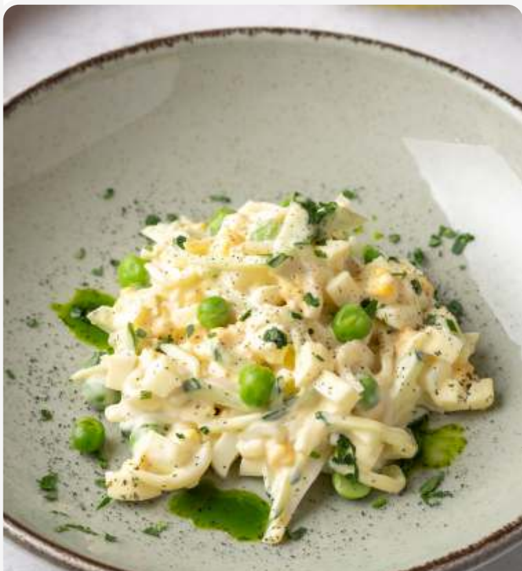
Салат с кальмаром и зеленым горошком