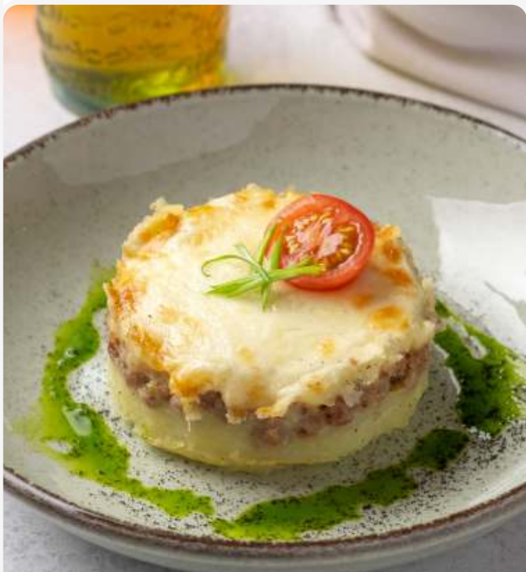
Картофельная запеканка с ягненком