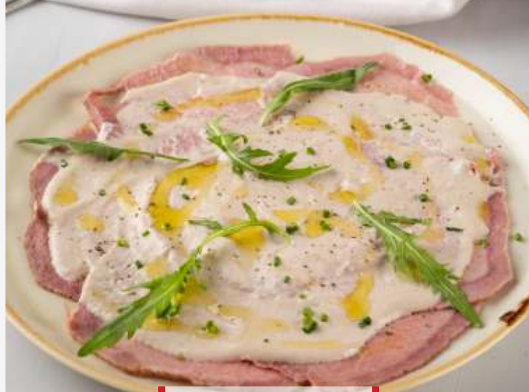
Вителло тонато с фриллисом