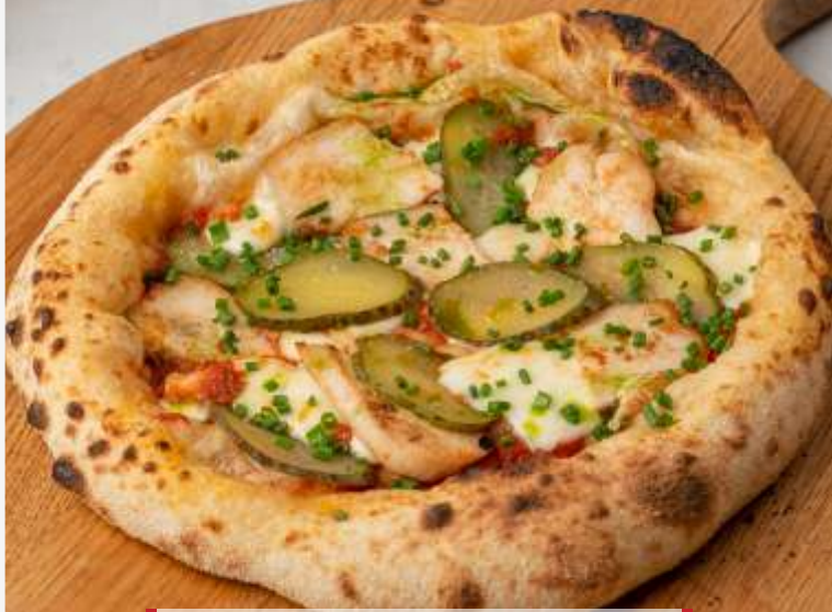
Пицца с цыпленком и маринованным огурцом 230g | 290.-