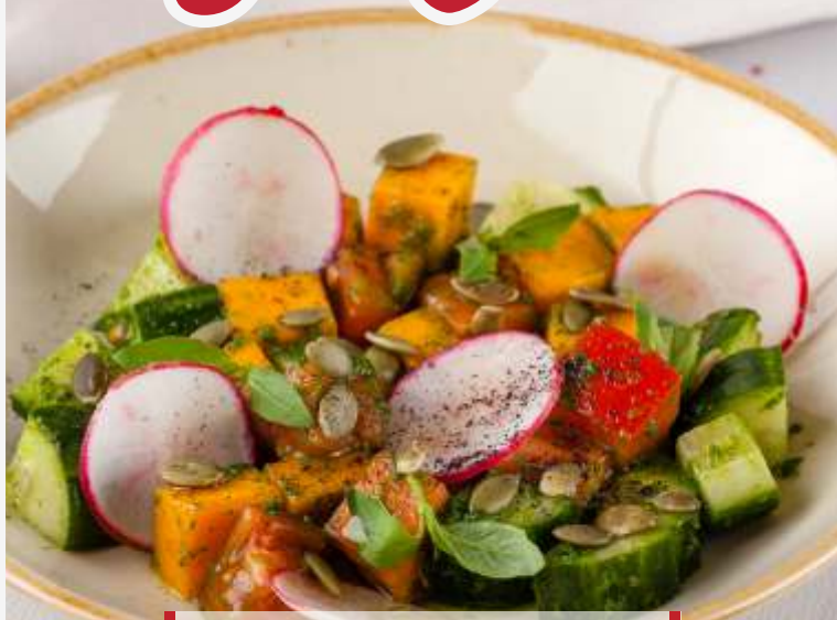
Салат из свежих овощей с печеной тыквой