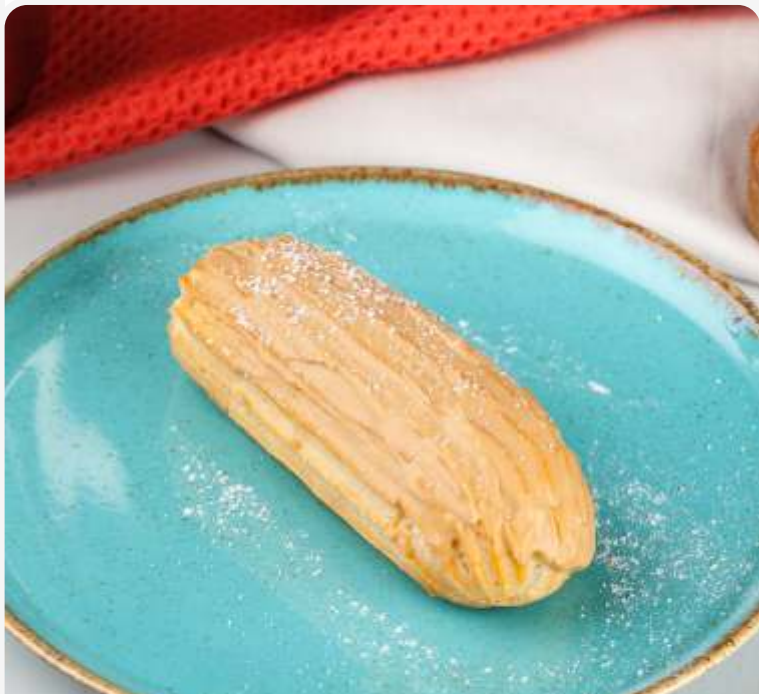
Эклер со сгущенным молоком 60g | 120.-

-30% НА ВСЕ ДЕСЕРТЫ - С ВИТРИНЫ - ПОСЛЕ 20:00