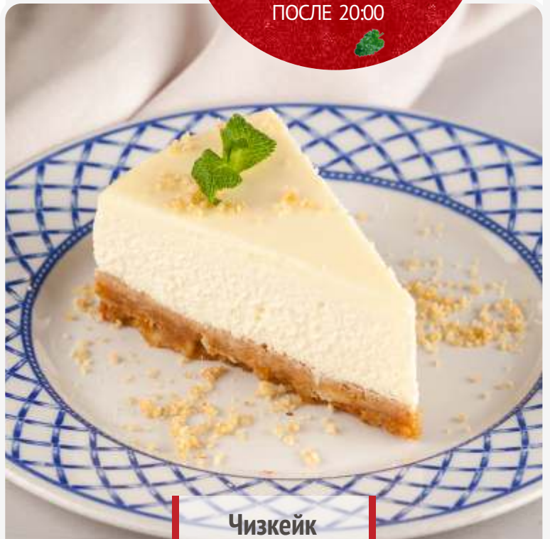
Чизкейк 110g | 220.-

Если у вас есть аллергия на определенные продукты, просим заранее сообщить об этом официанту.