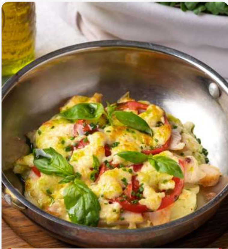
Курица Пармеджано с картофельным пюре и помидорами