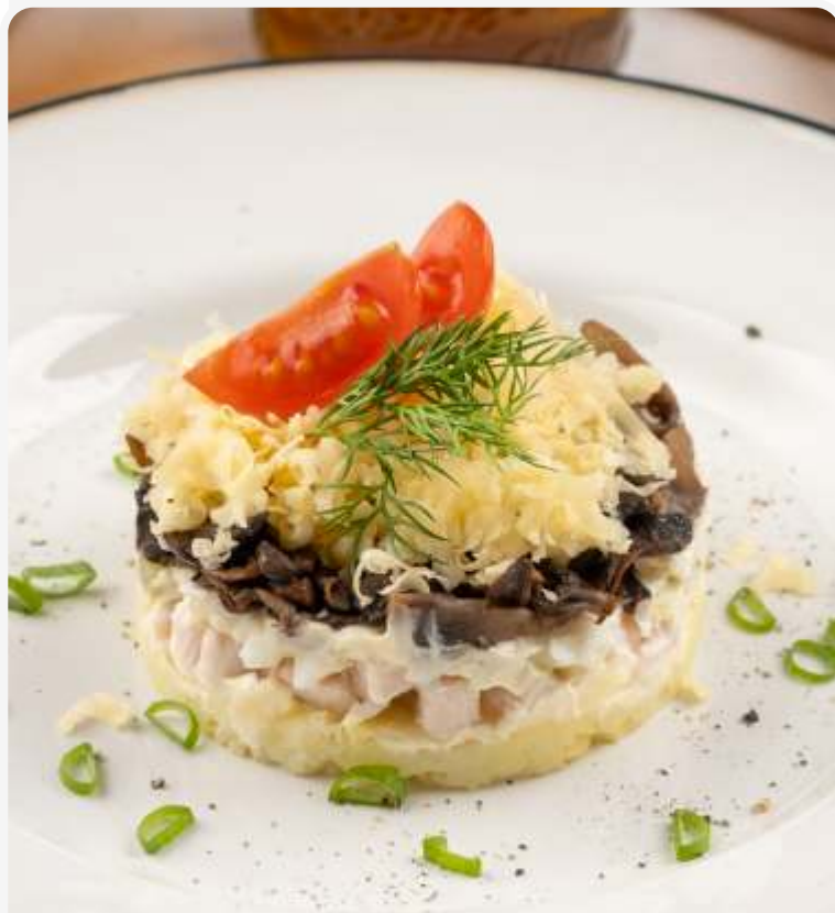
"Полянка" с копченой курицей