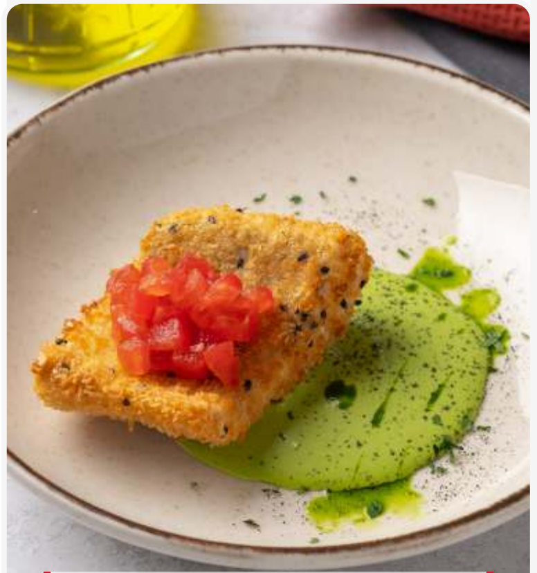
Хрустящий судак с айоли из петрушки и томатным тартаром