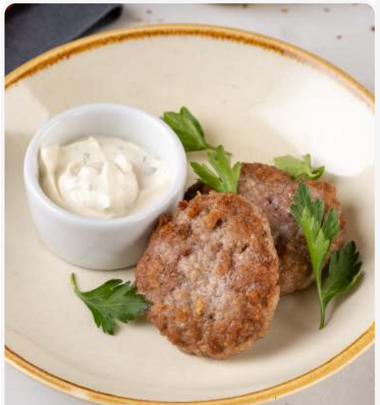
Мясные котлеты со сметанным соусом