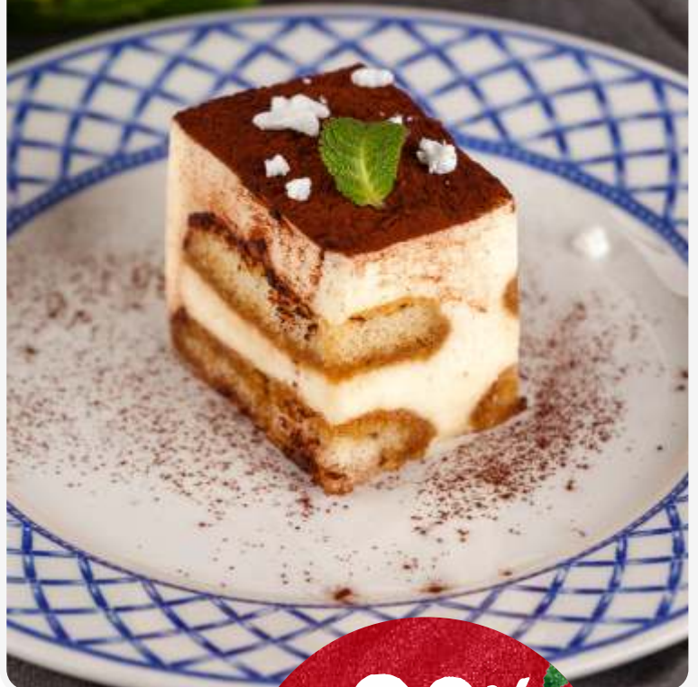
Тирамису 50g | 190.-