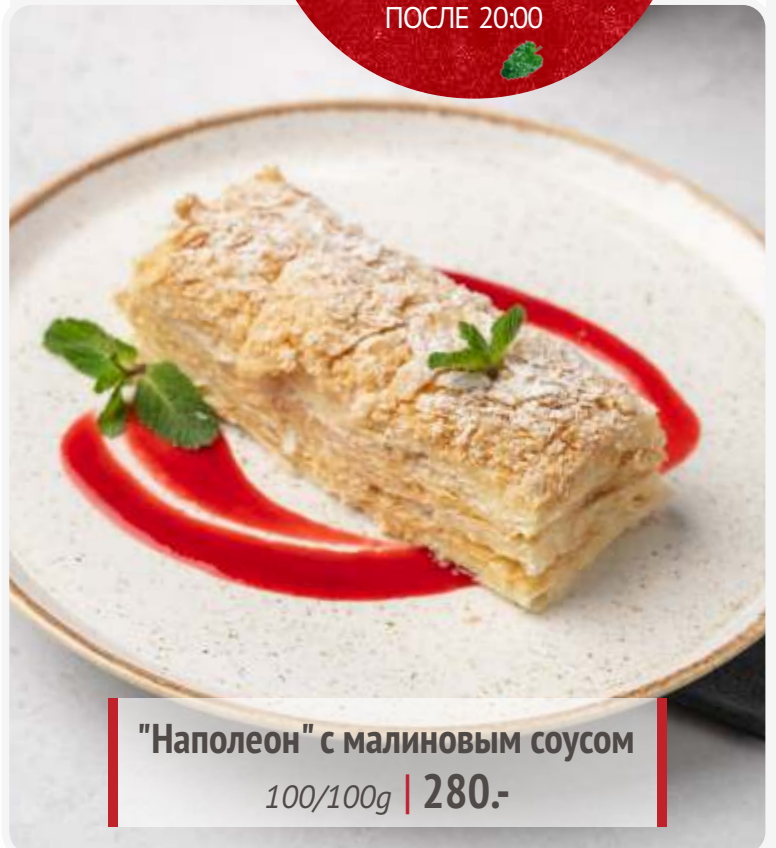
"Наполеон" с малиновым соусом 100/100g | 280.-

Если у вас есть аллергия на определенные продукты, просим заранее сообщить об этом официанту.