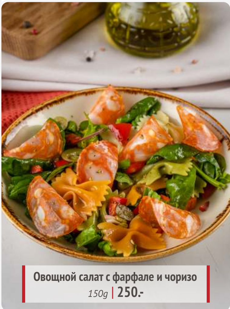
Овощной салат с фарфале и чоризо