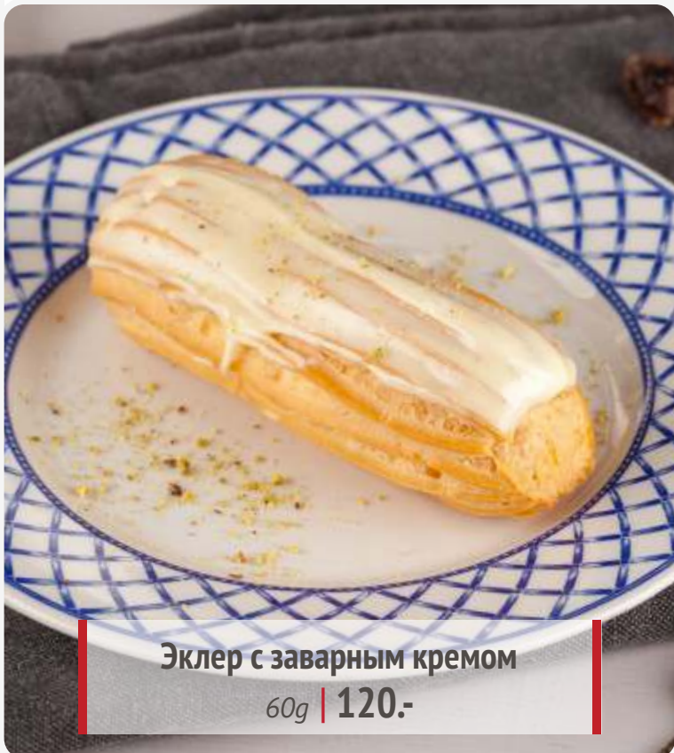
Эклер с заварным кремом 60g | 120.-

-30% НА ВСЕ ДЕСЕРТЫ - С ВИТРИНЫ - ПОСЛЕ 20:00