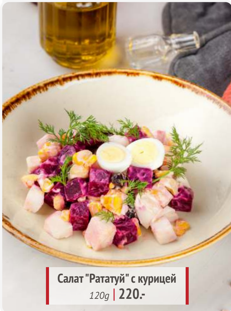
Салат "Рататуй" с курицей