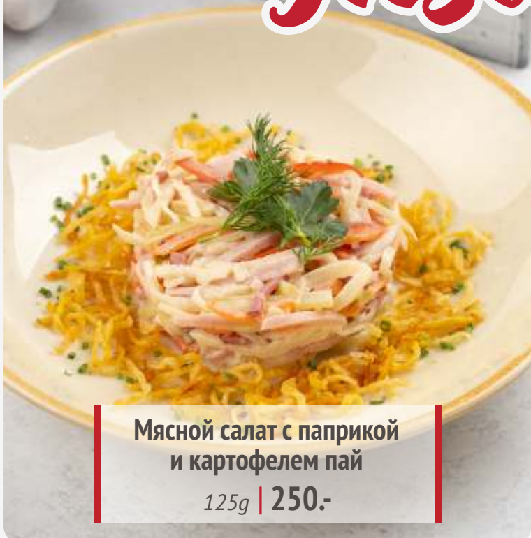
Мясной салат с паприкой и картофелем пай