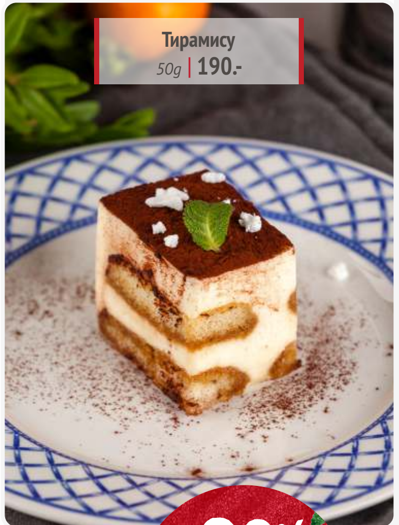
Тирамису 50g | 190.-